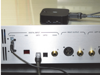
DC5V OUT 及び OPT 入力を接続

TaoTronics Bluetooth トランスミッター レシーバー TT-BA09 (実測充電電流約 150mA)