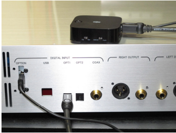
DC5V OUT 及び OPT 入力を接続

TaoTronics Bluetooth トランスミッター レシーバー TT-BA09 (実測充電電流約 150mA)